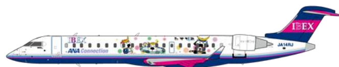
仙台・宮城観光 PR キャラクター「むずび丸」のラッピングジェット